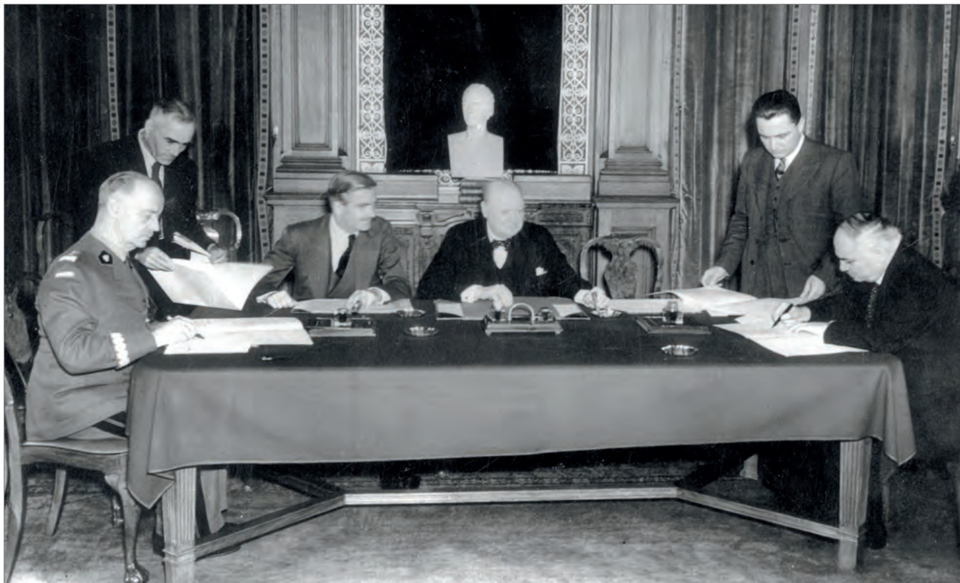
» Podpisanie układu, Londyn, 30 lipca 1941. Od lewej: Władysław Sikorski, Anthony Eden, Winston Churchill i Iwan Majska