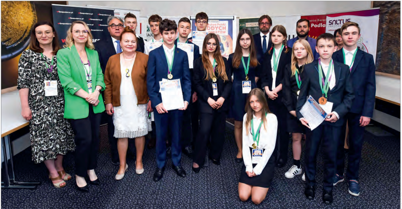
»» Finaliści XVII edycji konkursu „Mistrzostwa Polski Młodych Ekonomistów”

Ubezpieczenia, Fundacja Wspierania Ubezpieczeń Wzajemnych, Fundacja Grzegorza Biereckiego „Kocham Podlasie”. Spośród wszystkich uczniów biorących udział w konkursie, do finału została zakwalifikowana dziesiątka uczestników, których prace eliminacyjne zostały najwyższej ocenione przez jury konkursu.