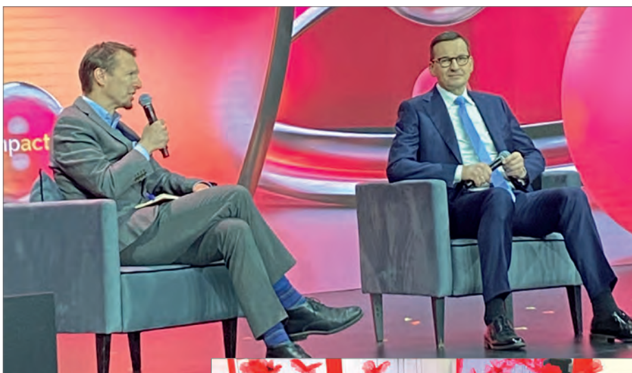
» Gościem kongresu Impact'23 był m.in. premier Mateusz Morawiecki

Tematy finansowe poruszone na kongresie były bardzo aktualne i pomocne w budowaniu oferty Kasy: „PKB, inflacja i stopy procentowe – stan gospodarki w Polsce, regionie i na świecie”, „Polityka pieniężna i fiskalna w czasach wysokiej inflacji i niepewnego wzrostu”, „Świat wysokiej inflacji – perspektywa sektora bankowego