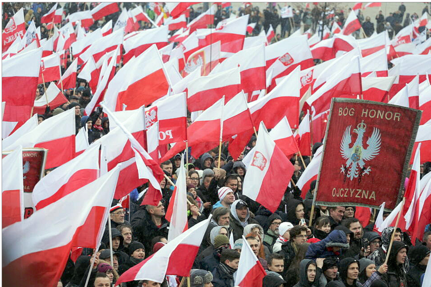
» Marsz Niepodległości

„Patriotyzm jest jak rasizm. Nie ma żadnego uzasadnienia moralnego – jest zbędnym reliktem przeszłości, pozostałością po czasach, gdy hordy plemienne wiodły wojny o terytorium, żywność i kobiety. [...] Powiedzmy wprost: fascynacja militarzami to smutny relikwyt naszej ewolucji i przeszłości plemiennej. Krwawe porachunki między grupami konkurującymi o terytorium, żywność i kobiety nie są typowe wyłącznie dla homo sapiens – większość naczelnych jest równie brutalna jak ludzie, a przemoc stosuje przede wszystkim wobec członków innych grup. To właśnie po małych odziedziczyliśmy te cechy, które owocują tak dziś gloryfikowanym przez prawicę egoizmem plemiennym czy narodowym” – pisał, starając się skutecznie wywołać u czytelników skojarzenia plemiennych hordy z prezydentem RP i politykami PiS.