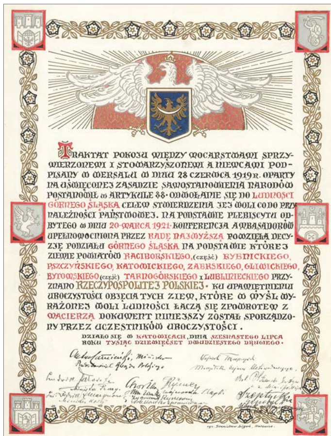
» Akt przyłączenia Górnego Śląska do Polski w 1922 r.

Przejmowanie kolejnych terenów dokonywane było w kilku etapach. 19 czerwca na katowickim Rynku odbyła się parada wchodzących w skład wojsk alianckich oddziałów francuskich i ich wymarsz z Katowic, zorganizowana na okoliczność podpisania aktu polsko-francuskiego