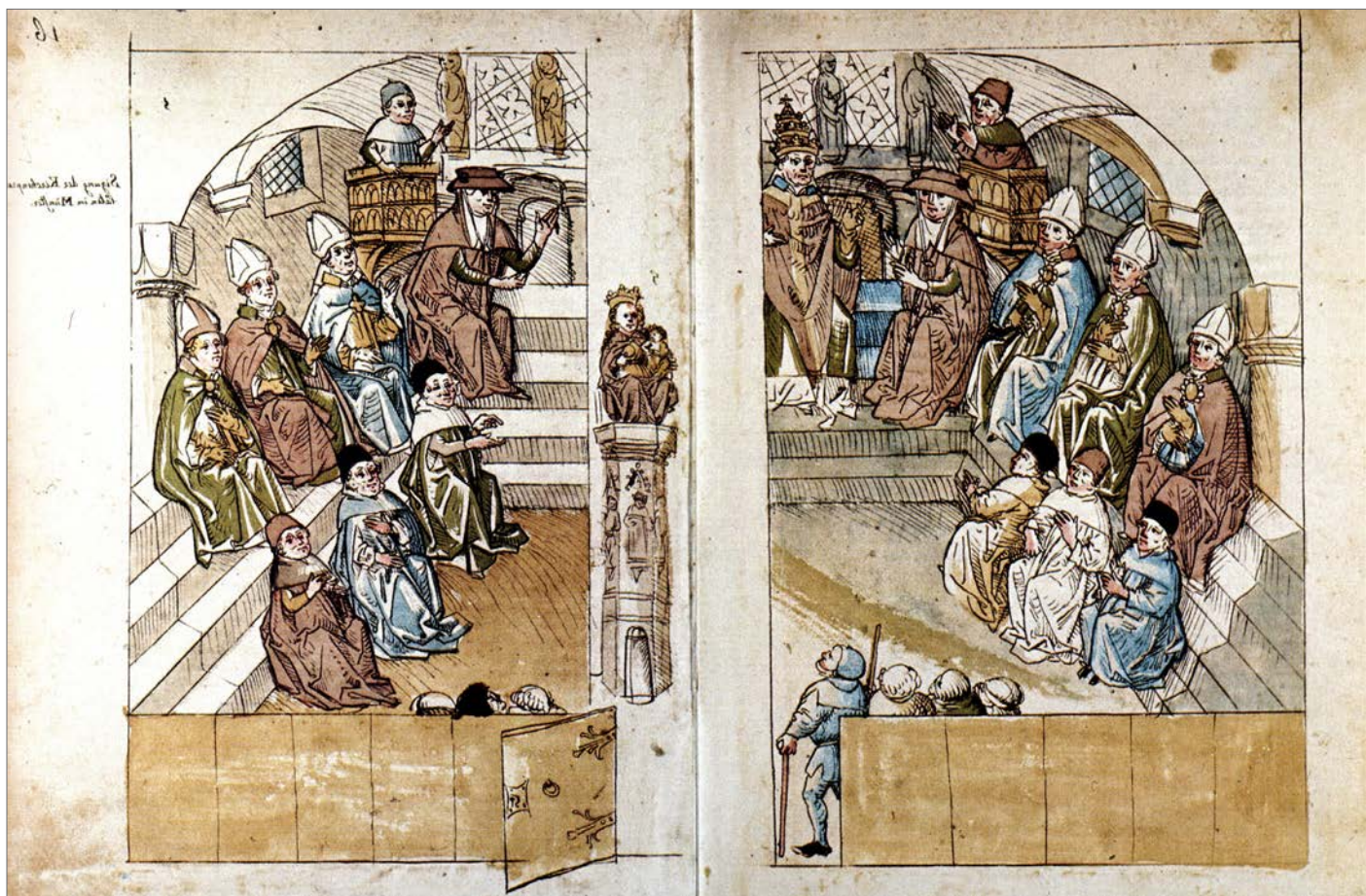
» Grafika z kroniki opisującej przebieg soboru w Konstancji, na którym Paweł Włodkowic – w imieniu króla Polski – przedstawił m.in. zasady wojny sprawiedliwej oraz praw człowieka i narodów

soborowej komisji wiary – uznane za „błędne, gorszące, podburzające, okrutne, krzywdzące i bezwstydne”.