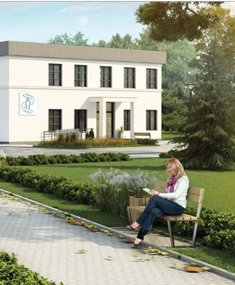
» Wizualizacja nowej siedziby hospicjum w Olsztynie