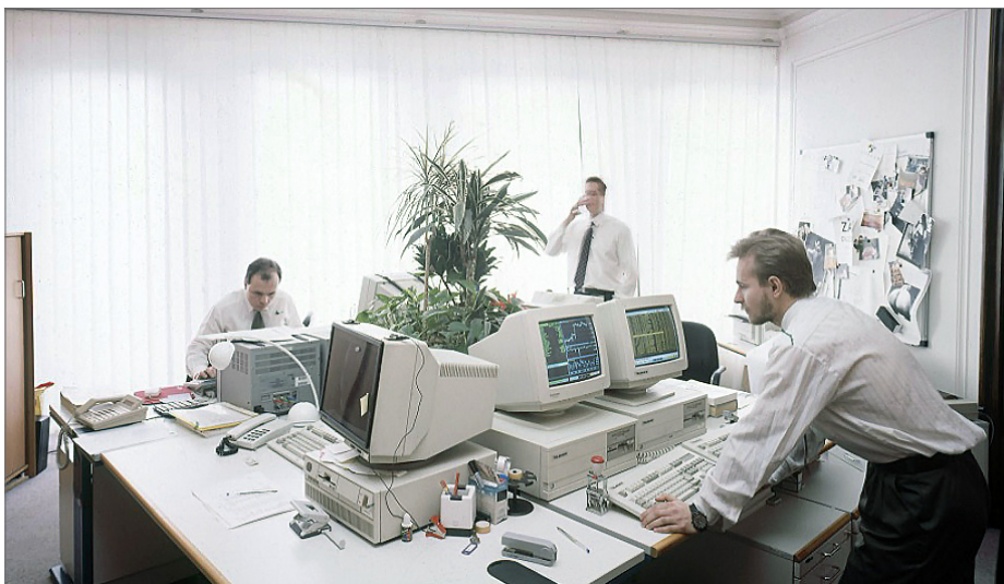
» Wnętrze biurowe w Centrum Bankowo-Finansowym w Warszawie. Na biurkach widoczne komputery PC Terlate, telefon oraz akcesoria biurowe (1994–1996)