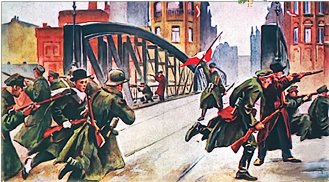
» Walki przy moście Chwaliszewskim w Poznaniu na obrazie Leona Prauzińskiego (1895–1940)