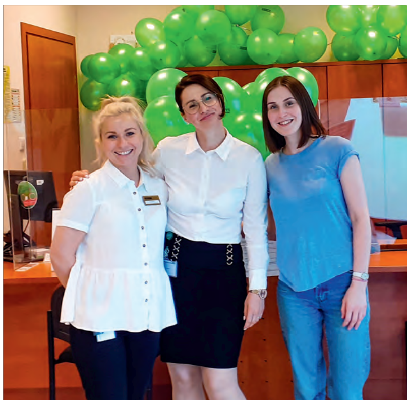
» GDYNIA. Placówka przy ul. Legionów 126-128