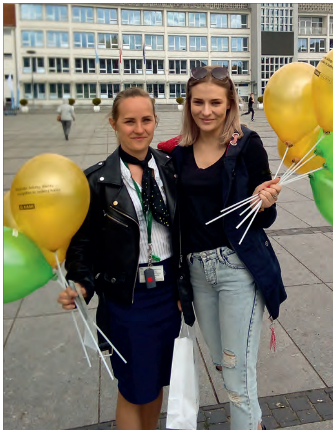
» KOSZALIN. Placówka przy ul. Zwycięstwa 90

Chcąc choć w minimalnym stopniu wrócić do tych spotkań (w ramach obowiązujących obostrzeń), Zarząd Kasy ustanowił 21 maja Dniem Kasy Stefczyka. Tego dnia czekaliśmy na Państwa w naszych placówkach i na ulicach miast.