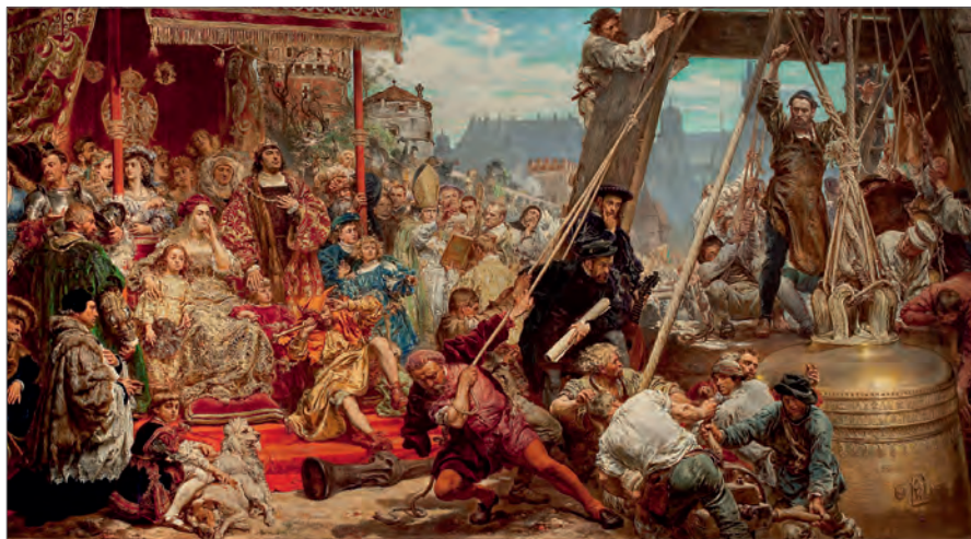
» Zawieszenie dzwonu Zygmunta na wieży katedry w Krakowie w 1521 r. (obraz Jana Matejki z 1874 r.)

Zygmunt uruchamiany jest ręcznie, przez zespół 8–12 ludzi. Przywilej bicia w ten dzwon