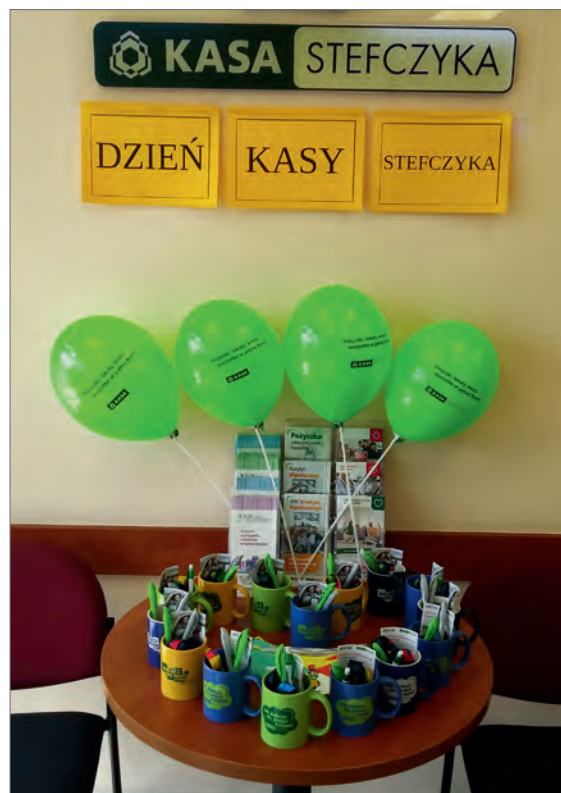
» BYDGOSZCZ. Placówka przy ul. Twardzickiego 29