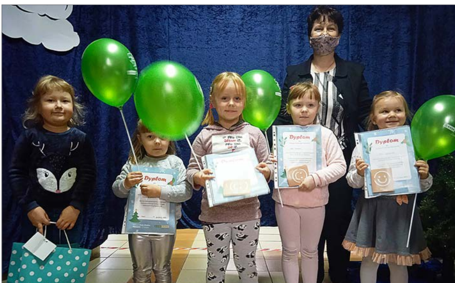
» Mławska placówka nagrodziła dodatkowo dyplomami i drobnymi upominkami dzieci, które wzięły udział w konkursie, choć nie zostały laureatami.