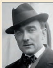
FOT. KOLEKCJA GEORGEA GRANTHAM BAINA (BIBLIOTEKA KONGRESU)